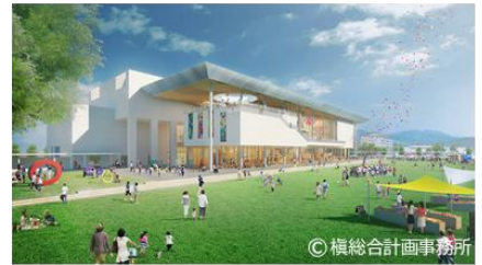
外観イメージ:多くの人が集い賑わいのある空間に