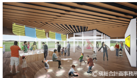
館内イメージ：展望テラスに隣接する特別展示コーナー